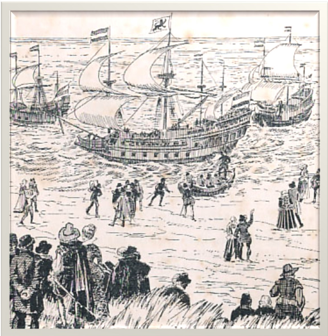
Prau - prau né Houtman saka ing tanah Walanda