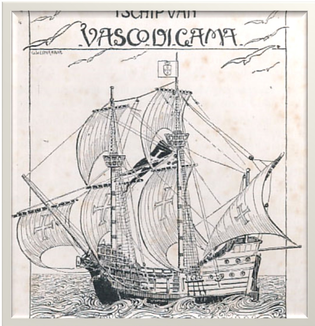
Prauné Vasco de Gama