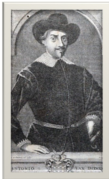
Gounerneur Generaal Van Diemen

Tumekaning saiki kabèh mau isih dipacak ana almenak, kayata: 1 Januari 1925 = 5 Jumadilakir Dal Windu Sengara 1855 (Jawa) = 5 Jumadilakir 1343 (Arab).