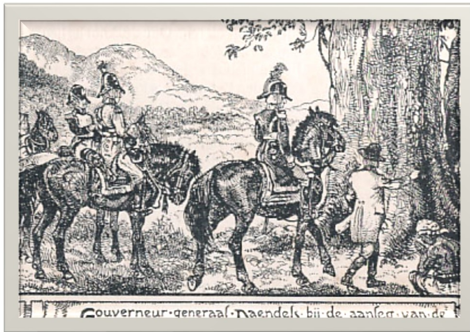
GG. Daendels Yasa Dalan Gedhé (1)