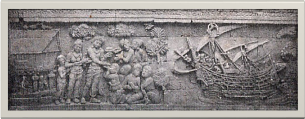
Relief Candi Barabudhur