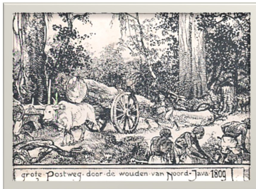
GG. Daendels Yasa Dalan Gedhé (2)