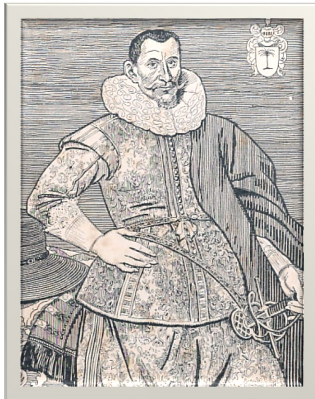
Jan Pieterszoon Coen