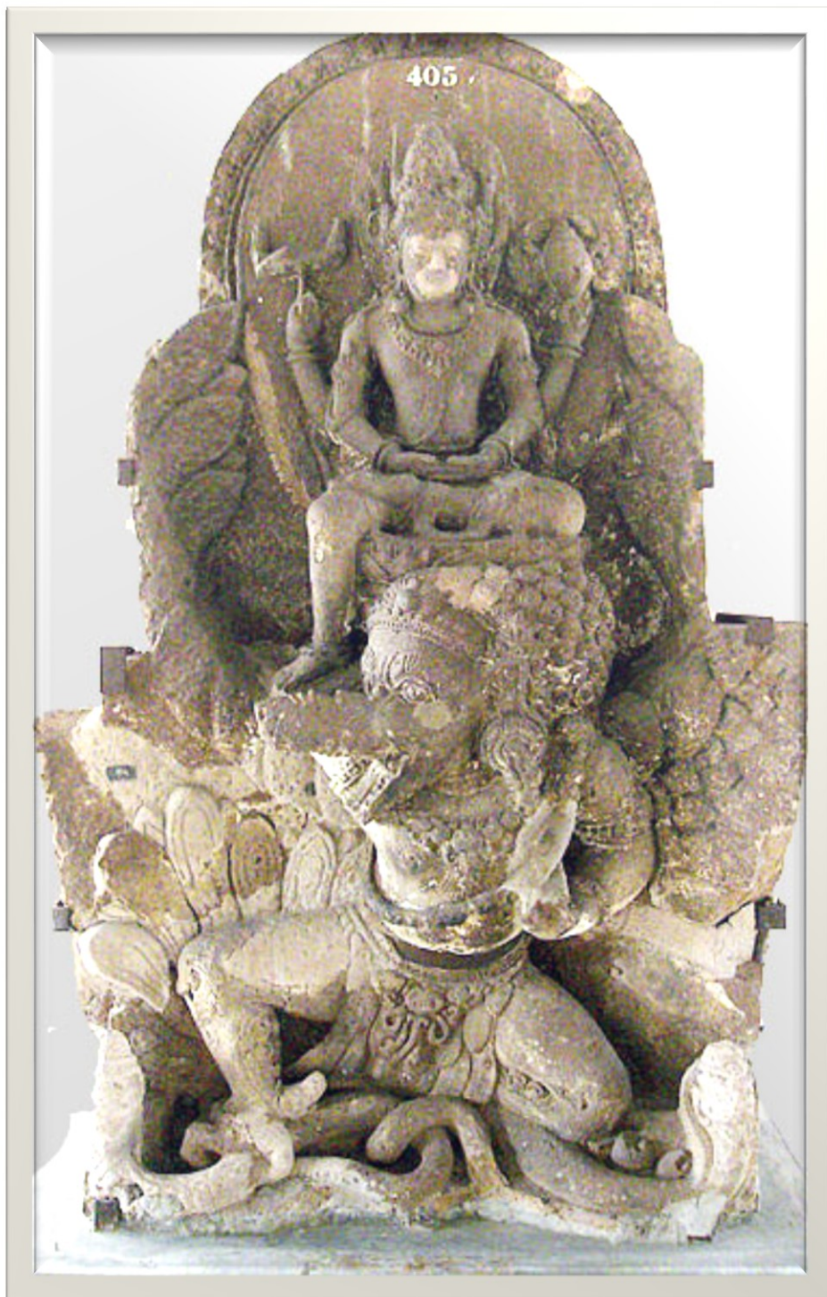
Recané Sang Prabu Erlangga ana ing Belahan