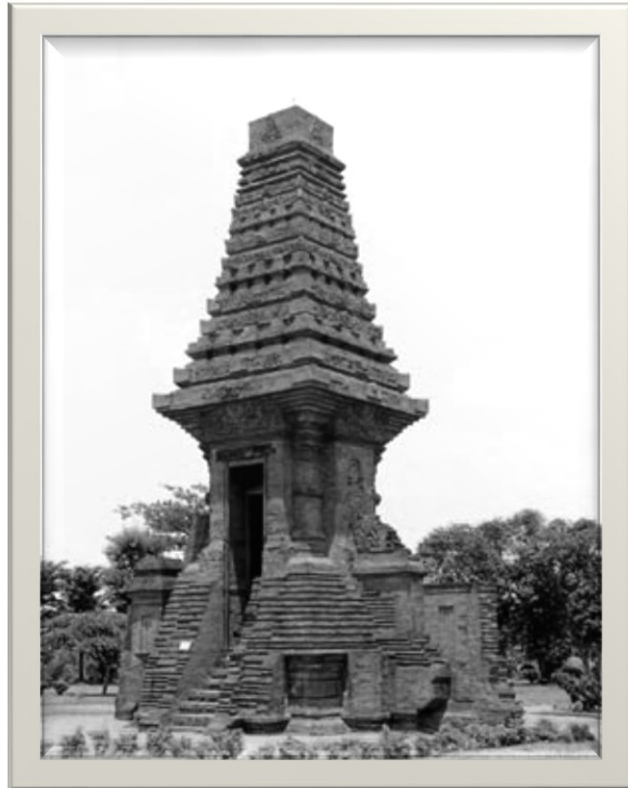
Régol patilasan bètèng Majapait, jenengé Bajang Ratu