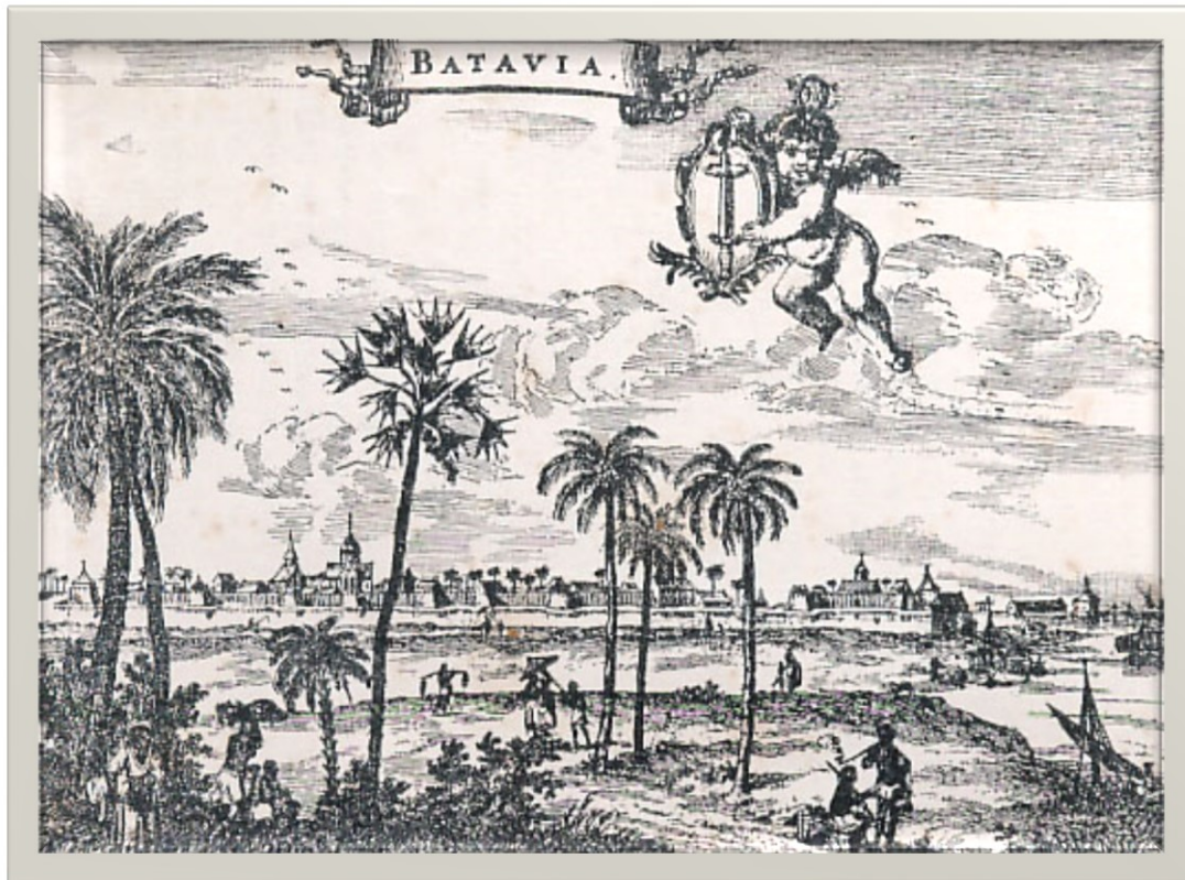
Kutha Batavia ing tahun 1682

Dhawuhé Paréntah katulis ing watu, tumekané saiki isih tetep mengkonu.