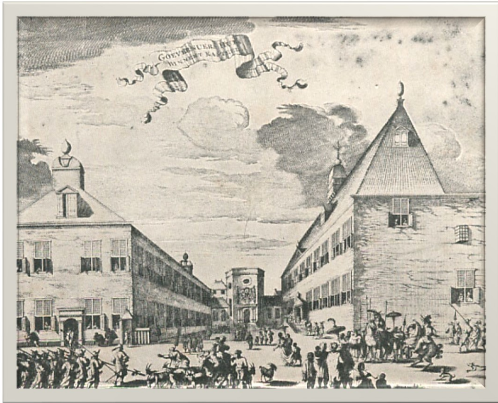
Daleme Gouverneur Generaal Ing Betawi